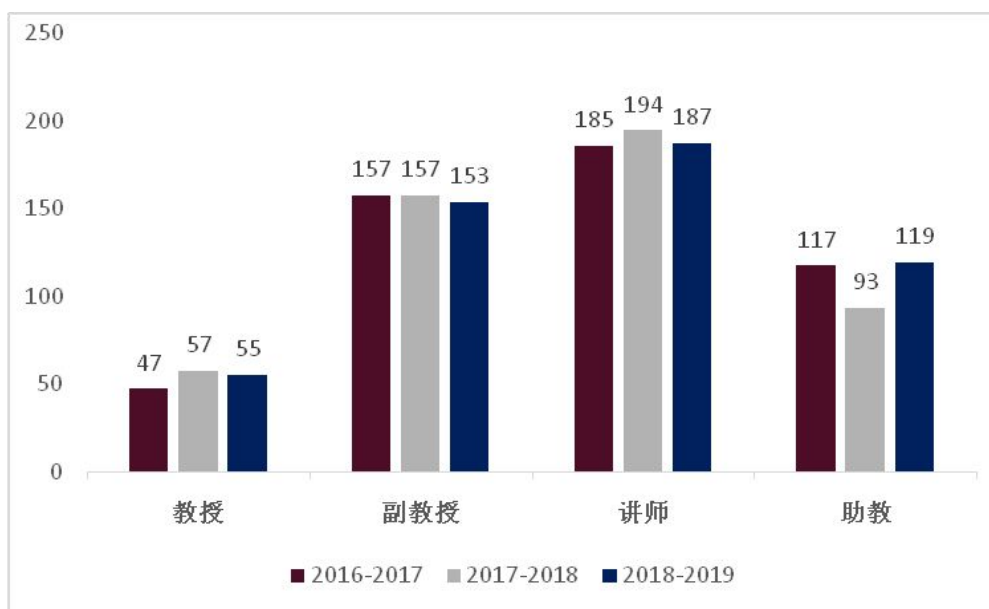
图 1：吉林艺术学院 2018—2019 学年专任教师职称结构状况图

2018-2019 学年的专任教师队伍中，“双师型”教师 149 人，占专任教师的 28.93%；教授 55 人，副教授 153 人，具有正高级职称教师占专任教师的 10.56%，具有副高级职称占专任教师的 29.37%，副高职称以上的教师数占专任教师总数的 39.9%，这些教学能力强、业务素质高的师资为学校发展提供了强劲动力。